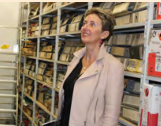
La Sénatrice Patricia Morhet Richaud en visite aux archives communales

prochains mois. La réception du bâtiment de l'ancien abattoir réaffecté en local à archives permettra de mener à bien ce projet en offrant toutes les conditions nécessaires. Celui-ci offrant un espace confortable et sain pour l'entreposage des documents. N'oublions pas que les archives doivent pouvoir être conservées durant des années, voire des dizaines d'années sans subir de dégradations majeures.